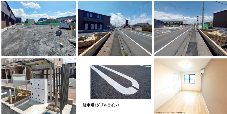
駐車場(ダブルライン)