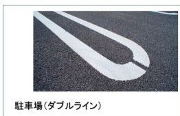
駐車場(ダブルライン)