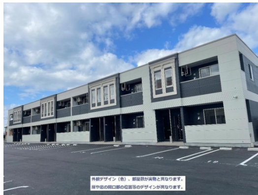
外観デザイン（色）、部屋感が実物と異なります。 扉や窓の開口部の位置等のデザインが異なります。