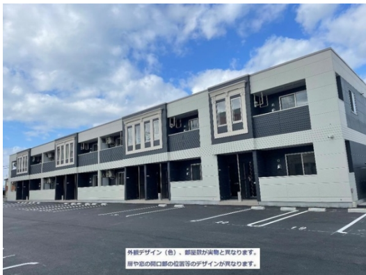
外観デザイン（色）、部屋割が実物と異なります。 扉や窓の開口部の位置等のデザインが異なります。