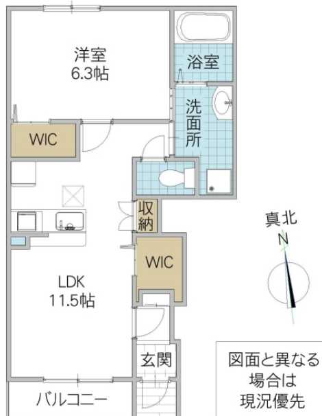
真北 N 図面と異なる場合は現況優先