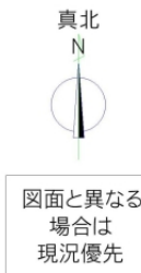
図面と異なる場合は現況優先