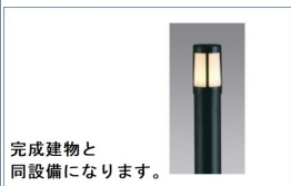
完成建物と同設備になります。