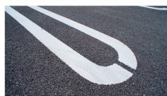
完成建物と同設備になります。