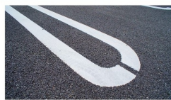
完成建物と同設備になります。