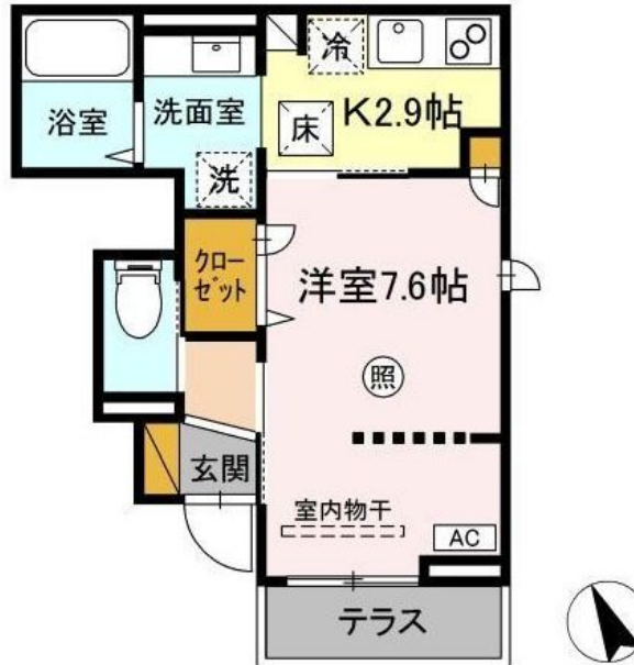
※図面と現況と異なる場合は現況を優先致します。