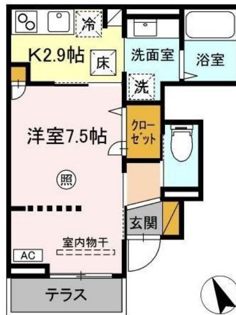
※図面と現況と異なる場合は現況を優先致します。