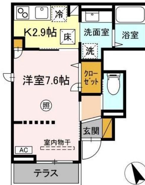
※図面と現況と異なる場合は現況を優先致します。