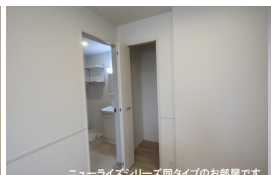
ニューライズシリーズ間タイプのお部屋です。