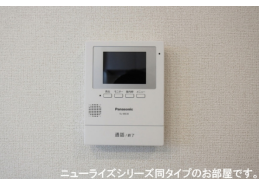
ニューライズシリーズ間タイプのお部屋です。