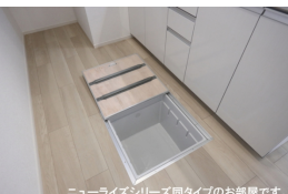
ニューライズシリーズ間タイプのお部屋です。