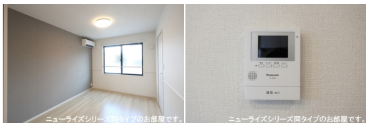
ニューライズシリーズ間タイプのお部屋です。