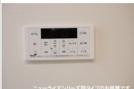
ニューライズシリーズ間タイプのお部屋です。