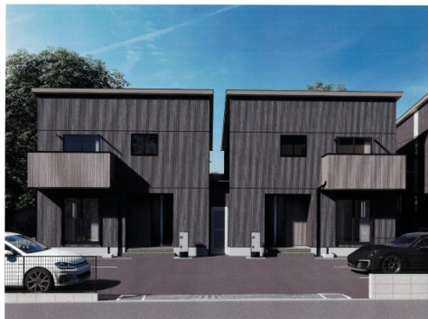
このイメージはイメージであり、実際の建物は異なる場合があります。