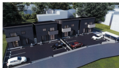
このイメージはイメージであり、実際の建物は異なる場合があります。