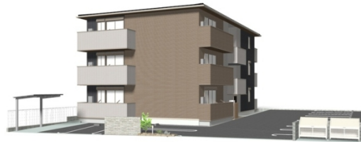
完成予想図につき実際とは多少異なる場合があります。