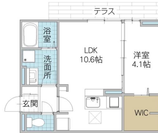
図面と異なる場合は現況優先