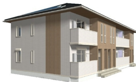
完成予想図のため実際とは異なる場合がございます。