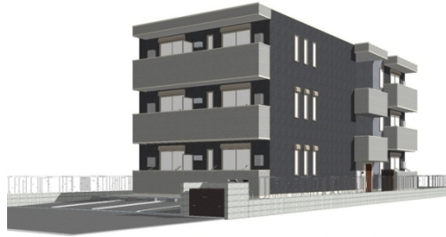
完成予想図につき実際とは多少異なる場合があります。