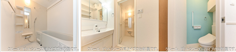
カレール ビットシリーズ同タイプのお部屋です。