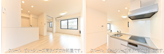
カレール ビットシリーズ同タイプのお部屋です。