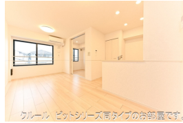
カーペット、ビッドシリーズ同タイプのお部屋です。