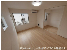
※クルールシリーズと同タイプのお部屋です。