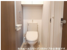
※クルールシリーズと同タイプのお部屋です。