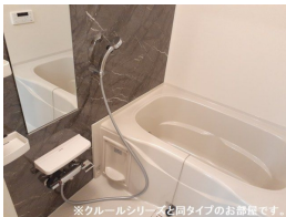
※クルールシリーズと同タイプのお部屋です。