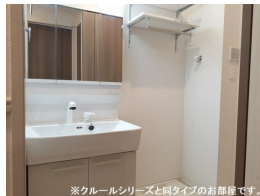
※クルールシリーズと同タイプのお部屋です。