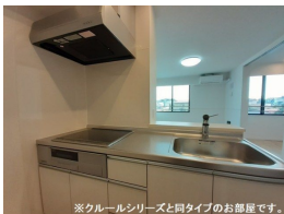
※クルールシリーズと同タイプのお部屋です。