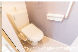
※ルタン・ラシックシリーズと同タイプのお部屋です。