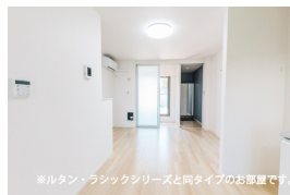
※ルタン・ラシックシリーズと同タイプのお部屋です。