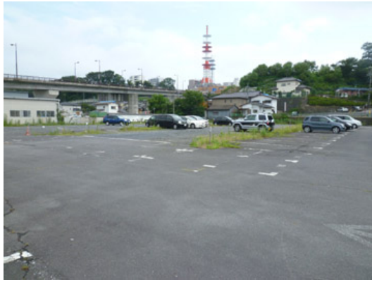
至五軒小 至 R349