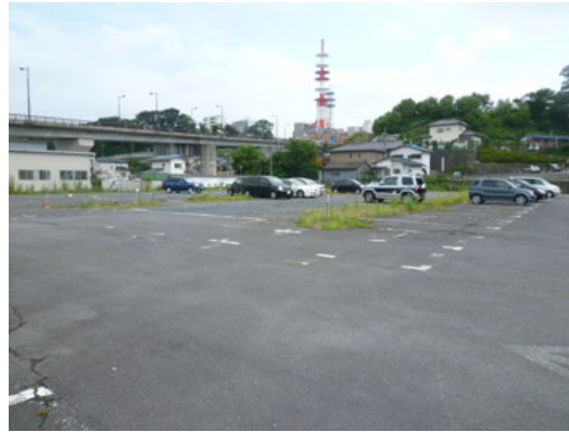
至五軒小 至 R349