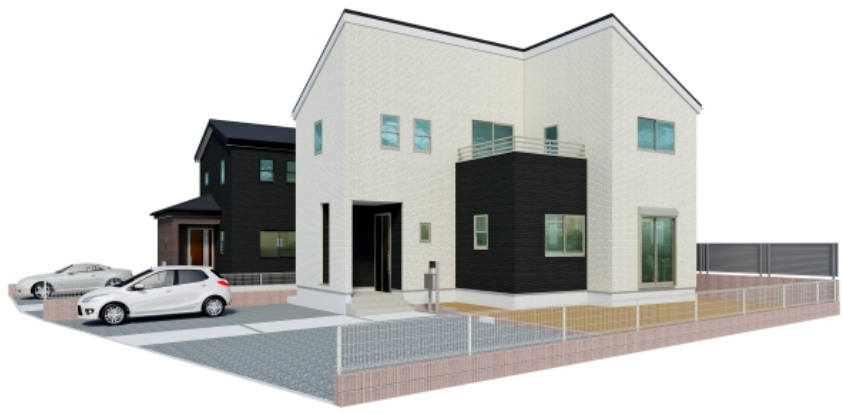
※掲載の完成予想CGは地形を基に書き起こしたもので、実際とは多少異なります。