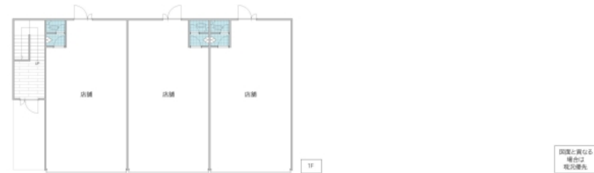
図面と異なる場合は現況優先