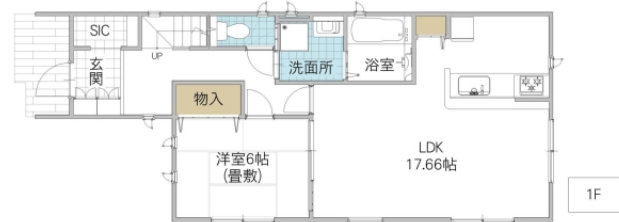
図面と異なる場合は現況優先